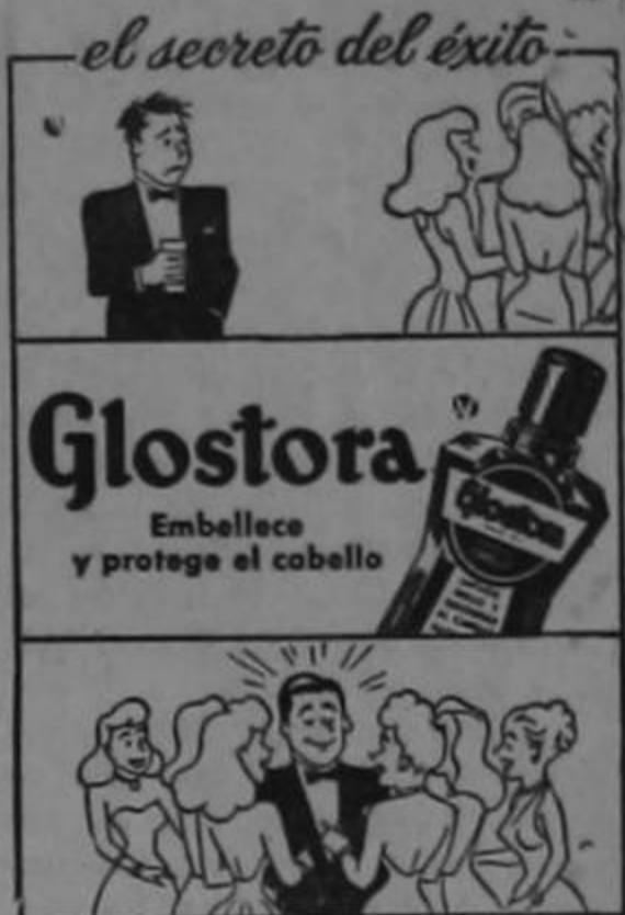
el secreto del éxito

Y después de darle y darle al seso, convinieron en que lo mejor sería pegarle un buen susto a los panameños. Así se podría prolongar el carnaval en la hermana del sur. Y como nosotros nos desvivimos no solamente por vivir nosotros bien, sino para que también existan felizmente todos los hermanos vecinos, resolvieron entre el Presidente Electo y el director de este semanario, inventarse lo de La Lindora, lo de los aviones, lo del anuncio, lo del bombardeo, y de allí es la cosa.